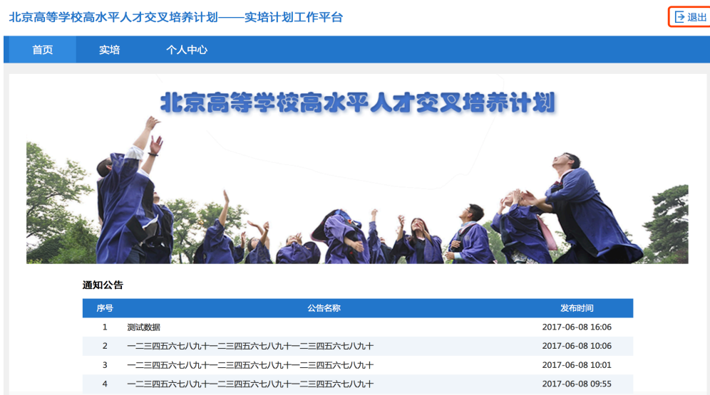
图 1-4 系统首页