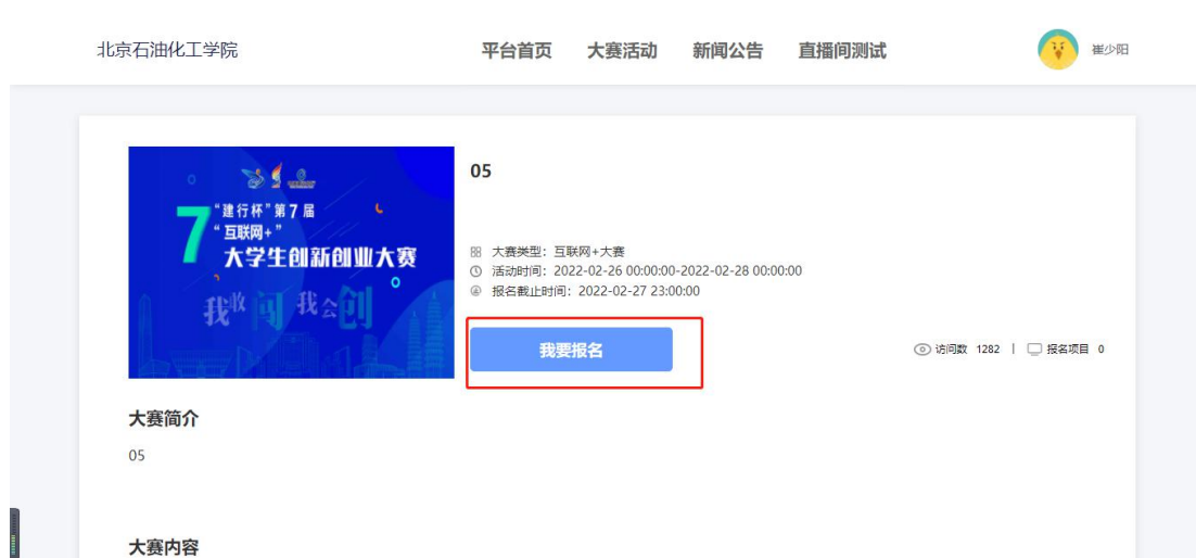
大赛活动详情页面