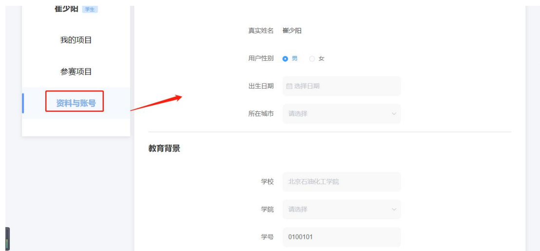
资料与账号修改页面