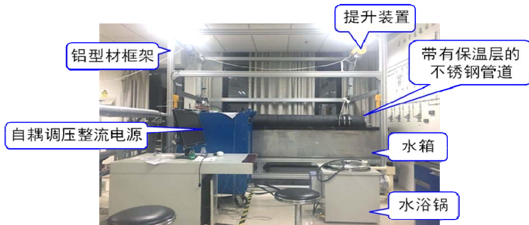
图 1 海底管道直接电加热解蜡堵实验模拟装置

海底管道直接电加热解蜡堵实验模拟装置（见图 1），并在此基础上开展了系统性实验研究。相关成果参加了第 16 次全国油气储运学术交流会，得到于达教授、敬加强教授、王玮教授等同行的一致好评。