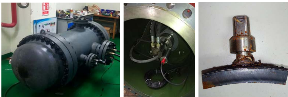
图 2 300m 米级高压低温水下摩擦螺柱焊焊接实验

②在中海油深圳分公司科研项目支持下，实验室完成了国内首次 300m 米级高压低温水下摩擦螺柱焊焊接实验（见图 2），并进行了焊接接头的各项力学性能测试，顺利通过中海油深圳分公司项目中期验收。