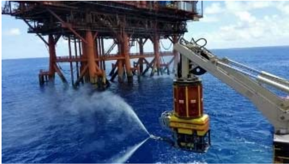
图3 国内首次使用 ROV 携带高压水枪进行导管架大面积海生物清理

④联合中国石油大学（北京）过程流体过滤与分离技术北京市重点实验室等研究机构，共同承办了 2018 年中国工程热物理学会多相流学术会议暨国家自然科学基金多相流项目进展交流会（会议地点北京昌平中石化会议中心，见图 4）。来自国内外 60 余所高校、科研院所的多相流领域资深专家学者和学生代表共 600 余人参加会议。