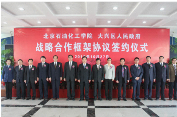
参加签约仪式的校区领导合影